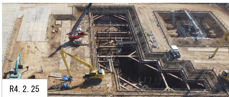
R4. 2. 25