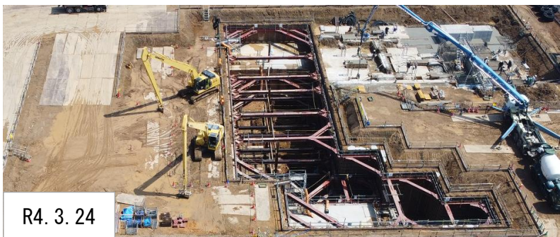
R4. 3. 24