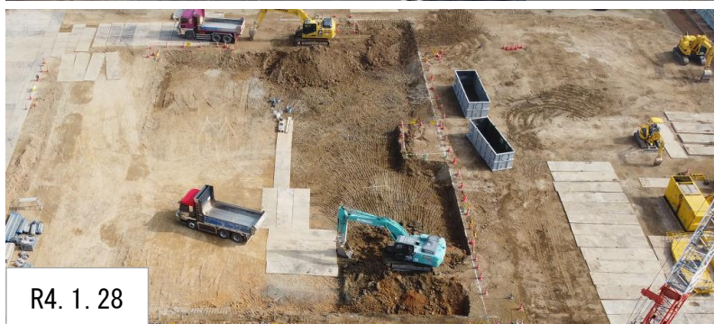
R4. 1. 28