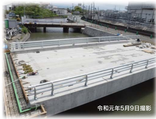
令和元年5月9日撮影