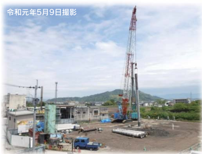
令和元年5月9日撮影